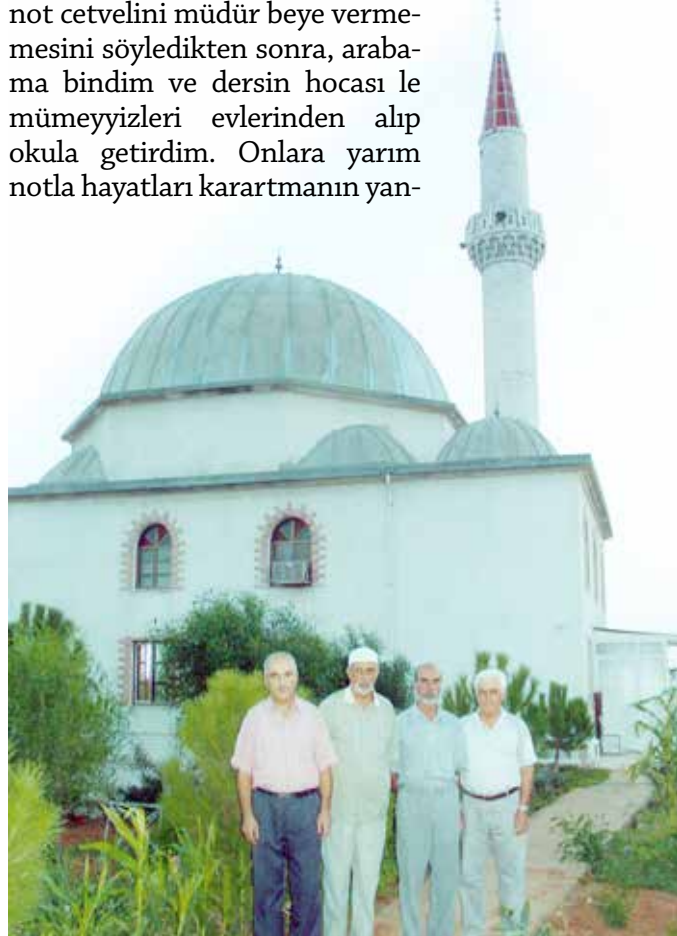
Barbaros Hayrettin Paşa Camii, Didim - Aydın.

Son bir hatıram da Konya’da öğretmenliğimle ilgili. Bir gün idari binadan atölyeye doğru gidiyordum. Banklardan birisine oturan bir öğrencinin hıçkırık hıçkırık ağladığını gördüm. Gencin yanına gidip neden ağladığını sorunca öğrenci. “ Hocam, İngilizce imtihanına girmiştım. Dörtle belgeleniyorum. Hayatım söndü ” dedi. Önce müdür muavinine not cetvelini müdür beye vermemesini söyledikten sonra, arabama bindim ve dersin hocası le mümeyyizleri evlerinden alıp okula getirdim. Onlara yarım notla hayatları karartmanın yan-