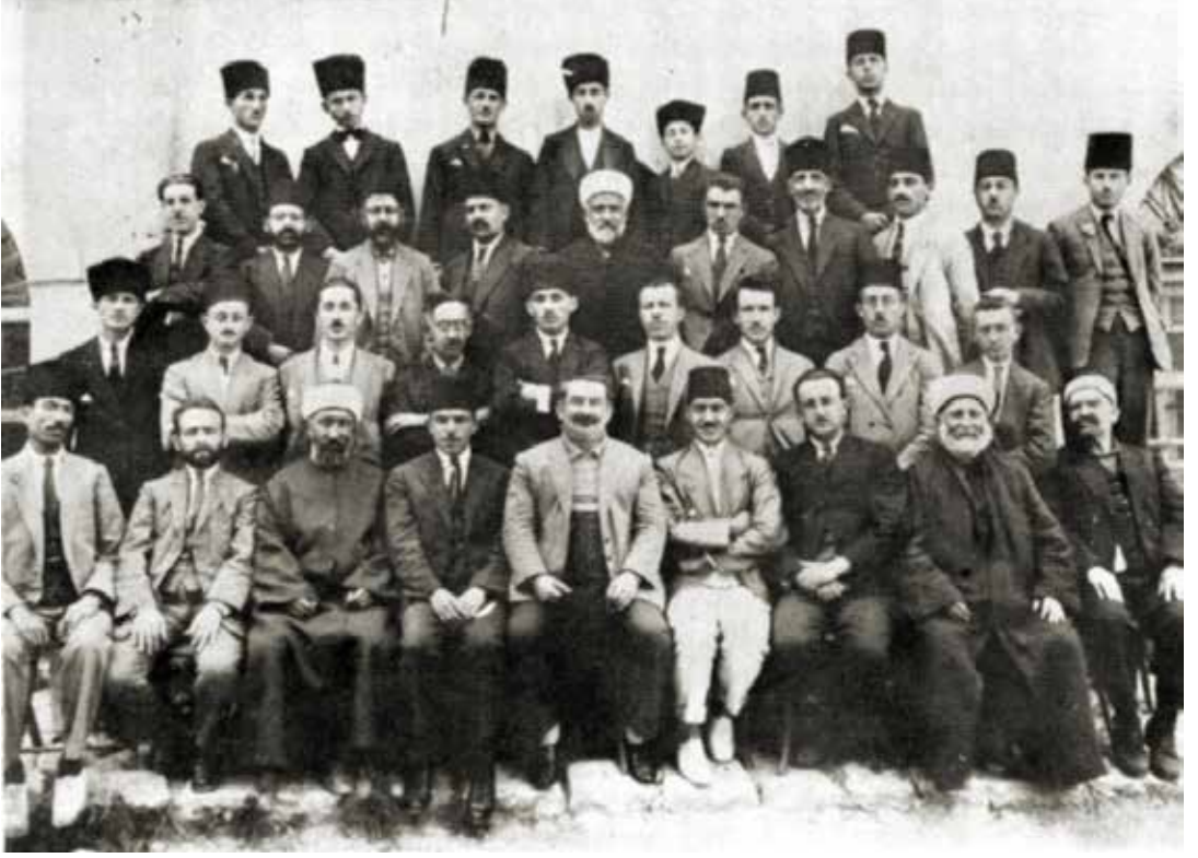
1920'lerde Konya Lisesi