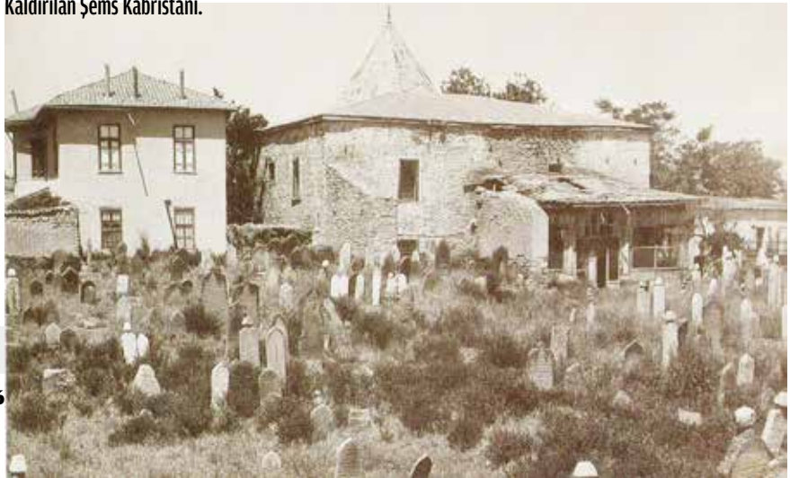
Kaldırılan Şems Kabristanı.