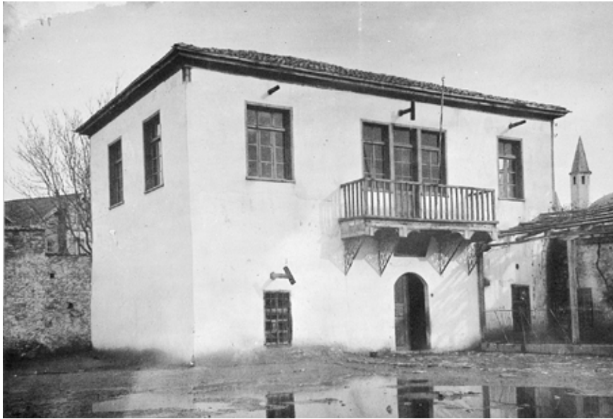
Mevlâna Dergâhı'nın Dervişhan Kapısı'nın solunda yer alan Türbe Okulu.

Hoca bu sırickla uzakta tek durmayan çocukları ansızın dürtter devirirdi. Daha fazla haylazlık edenler olursa hocanın işaretleriyle o çocuk kalfalarla yakalanır, yere yatırılarak ayakları falaka