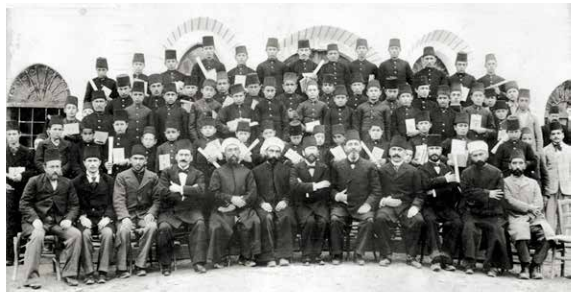
1900 yılı, Konya İdadisi.

Piri Mehmet Paşa Mektebi'nden çıktığımı ve bir parça da Medreseye gittiğimi söyledim.