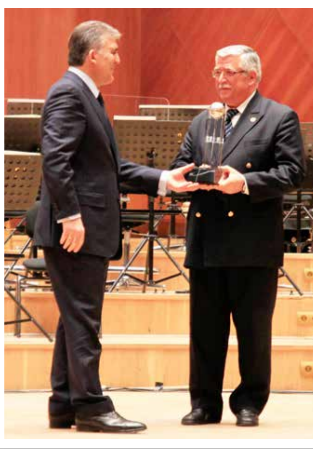
Cumhurbaşkanı Abdullah Gül'den Kültür Sanat Büyük Ödülü takdimi.

sik musiki ile Mevlevî musikisine aşına, tavırları gayet güzel bilen bir üstattı. Uzun yıllar bir gazete de