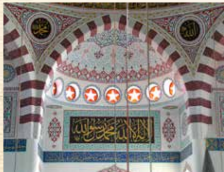
Kapu Camii merkez kubbe. Sydney Auburn Camii Avustralya