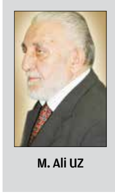
M. Ali UZ

Konya'da Rumlar genellikle Alâeddin Tepesi'nin güneyinde Gazialemşah Mahallesi ve çevresinde otururken, Hekim Sava'nın köşkü Ermenilerin oturduğu Çiftemerdiven Mahallesi'nde idi.