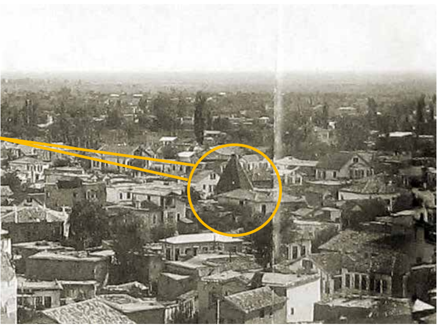
1930'lu yıllarda Hekim Sava'nın köşkünün bulunduğu Çifte Merdiven Mahallesi. (1930, İbrahim Tongur)

Seyfettin Karasungur Türbesi ve çevresindeki tarihi Konya evleri.