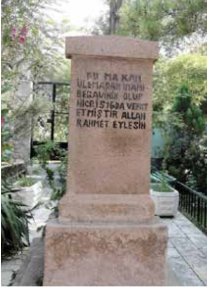
İmam Begavi'nin Makamı.