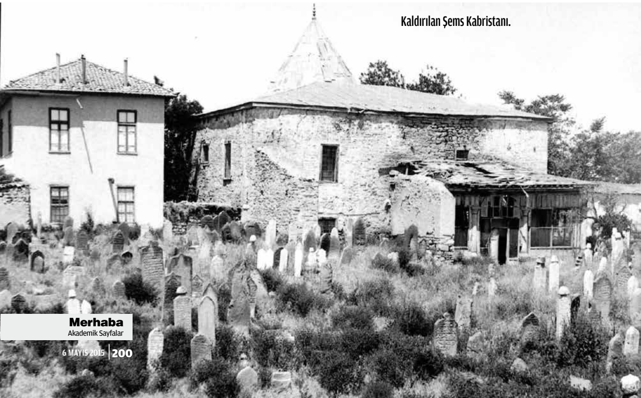
Kaldırılan Şems Kabristanı.

Kış geceleri, hikâye, masal ve menkıbeler anlatılırdı. Radyo ve televizyon yoktu. Yüzük, fincan gibi oyunlar oynanırdı. Annem çok güzel ve uzun menkıbeler anlatırdı. Bazı kış gecelerinde, yatmaya yakın açınıldığında yat geberlik denen bir şeyler yemek adettendi. Yiyecek olarak sofraya, kıyma, sucuk, hevenklik üzüm ve peynir gibi şeyler konurdu.