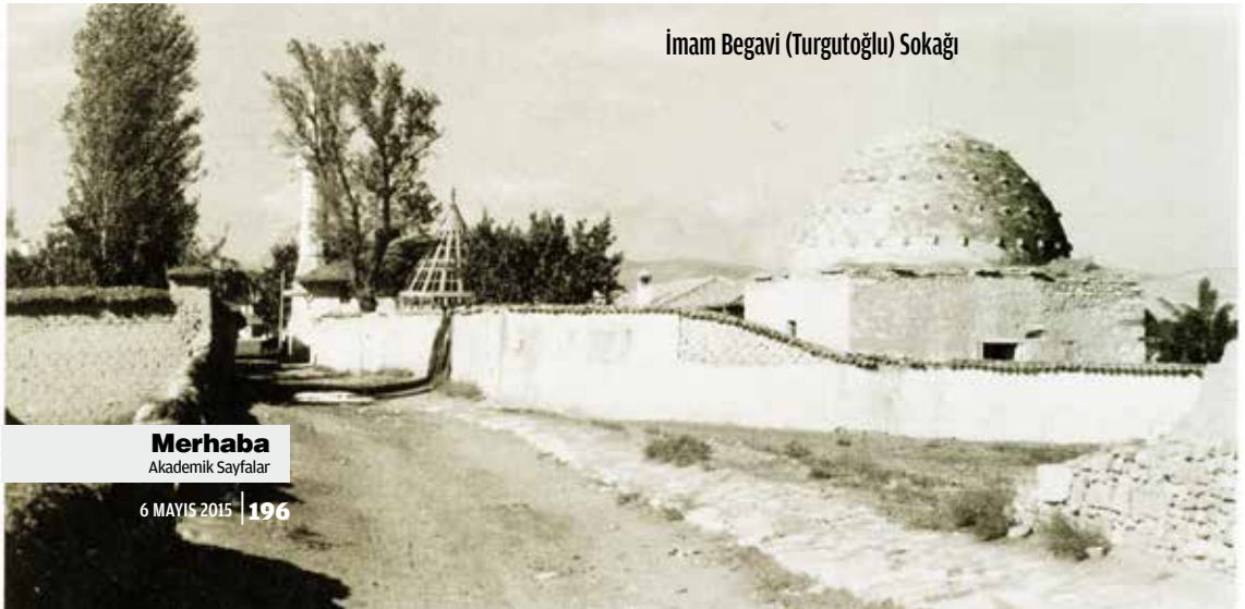
İmam Begavi (Turgutoğlu) Sokağı