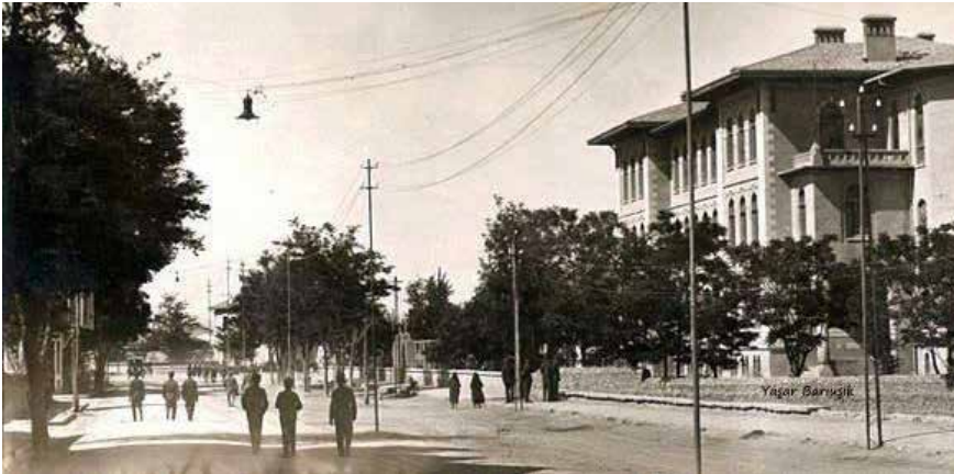
Erkek Muallim Mektebi (Konya Lisesi)

Bugün Konya Lisesi olarak anılan okul o yıllarda Erkek Muallim Mektebi idi. Lise ise Karma Orta Okulu'nun yerinde idi.