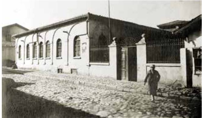
Akif Paşa Mektebi

1874'de Konya valisi olan Ahmet Paşa tarafından yaptırılmıştır. Konya'nın ilk rüştiye mektebidir. O tarihlerde iki öğretmenle öğretime açılmıştır. 1874 yılında kız kısmı da öğretime açılmıştır. Büyük çarşı yangını ile yanan okul 1878'de şimdiki Merkez Yapı Kredi Bankası binasında Konya Valisi Akif Mehmet Paşa tarafından eğitim öğrenime açılmıştır. 1882 'de 4 öğretmen, 1 hademe ve 98 öğrenci ile öğretim sürdürmüştür. 1891 yılında