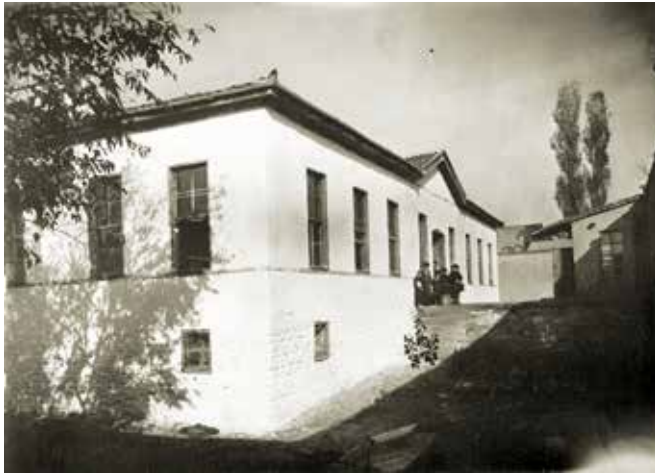
Mahmut Şevket Paşa Mektebi

da 4 sınıflı, 1941 yılında 5 sınıflı olmuş, eğitim öğretim çalışmalarını sürdürülmüş ve ilk mezunlarını vermiştir. 1955-56 yılında 9 derslikli olarak yeni bir bina yapılmıştır. 1997-1998 eğitim öğretim yılında ilköğretimin 8 yıla çıkarılması ile okul adı İhsaniye İlköğretim Okulu adını almıştır. 2012 tarihinde yayımlanan 4+4+4 zorunlu eğitim yasası ile okul tekrar İhsaniye İlkokulu olmuştur. 2013'de okulun yerine yapılan yeni binanın Mehmet Ali ve Kadriye Atiker İmam Hatip Orta Okulu olarak; İhsaniye İl-