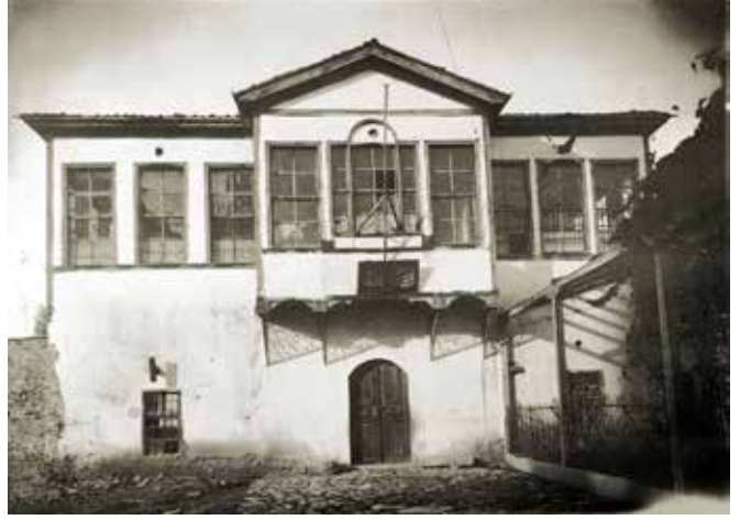
Dumlupınar Mektebi (Sultan Veled Medresesi)

Dumlupınar Mektebi, Mevlana Dergâhı civarındaydı. Selçuk Es bu okulun yerini: “Mevlânâ Müzesi’nin bugün müdür lojmanını olarak kullanılan Çelebi Efendi Dairesi’nin batısında ve meyda-