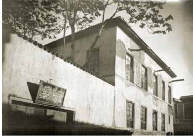
Rehber-i Hürriyet Mektebi

Rehber-i Hürriyet Mektebi'nde H.1332/M.1913-1914 Konya Salnamesine göre 70 öğrenci bulunmaktaydı ve o yıla kadar okuldan mezun olan öğrenci sayısı 75 idi. Bu okula ait bir cetvelde 1918 yılında okulda 34 öğrencinin bulunduğu kayıtlıdır. Selçuk Es, 1921 yılında öğrenci sayısının 60-70 civarında olduğunu ayrıca okulda 25-30 kadar da Konya Darüleytam Mektebi öğrencisinin bulunduğunu belirtmektedir. Rehber-i Hürriyet Mektebi'nin, Cumhuriyet Devri'nde Hapishane Caddesi'nde bulunan başka bir binada hizmet