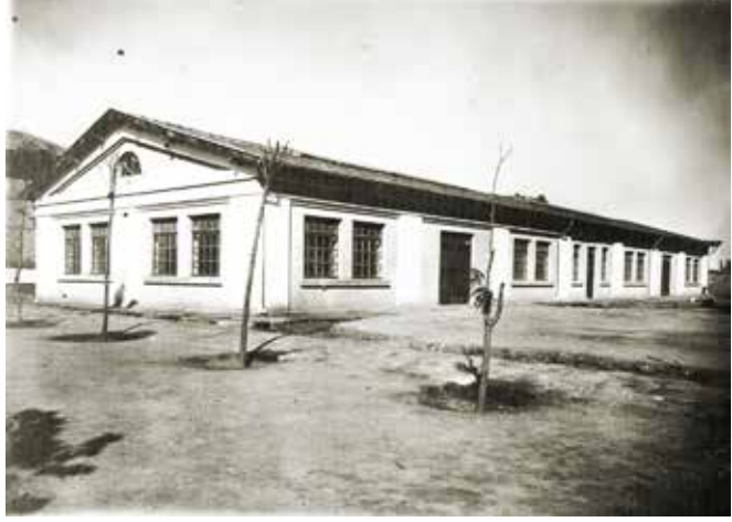
Sanat Mektebi Marangoz Atölyesi

Konya Sanayi Mektebi'nin amacı fakir ve kimsesiz çocukları himaye etmek, sanâyi ve sanat konularında uygulamalı bilgiler vererek onları meslek sahibi yapmaktı. Aynı zamanda okul şehirdeki sanayinin gelişmesinde öncü rol oynayacak ve teknik eleman ihtiyacını karşılayacaktı. Konya Sanayi Mektebi 1901 yılında üç yıl süreli bir kurum olarak eğitim-öğretime başladı. Öğretimin esasını meslek dersleri oluşturmakla birlikte ders programlarında rüştiyenin üzerinde nazari derslerde yer almaktaydı. Öğrenciler sabahları iki saat nazari dersleri gördükten sonra atölyelere geçerek altı saatte uygulamalı sanat derslerini takip ederlerdi. Okulda 1912 yılına kadar nazari ders olarak Kur'an, Ulüm-ı Diniye, Türkçe, Musiki, Hüsn-i Hatt, İmlâ ve Kıraat, Tarih, Coğrafya, Hesâb ve Hendese dersleri okutulmuştu. Aynı dönemde okulda sanat şubesi olarak Demircilik, Tesviyecilik ve Marangozluk birimleri bulunmaktaydı. Sanayi Mektebi'nin öğretim süresi 1912'de dört yıla çıkarıldı. I. Dünya Savaşı'na girilmesi nedeniyle 1915 yılında ordunun ihtiyaçlarını karşılamak amacıyla okulda Kunduracılık, Terzilik, Çorapçılık ve Fanilacılık şubeleri açıldı. 1922 yılında bunlara Arabacılık şubesi ilave edildi. 1923 yılında bu şubelerin tamamı lağvedilmiştir. Okulun eğitim-öğretim sistemi 1924 yılında değiştirildi. Yeni sisteme göre Sanayi Mektebi ilk üç yılı teorik ve uygulama, son iki yılı sadece uygulamalı meslek derslerinin