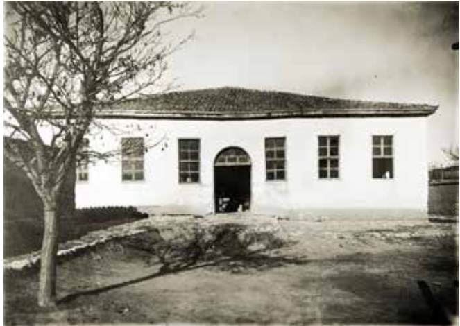
Şehit Sadık Mektebi