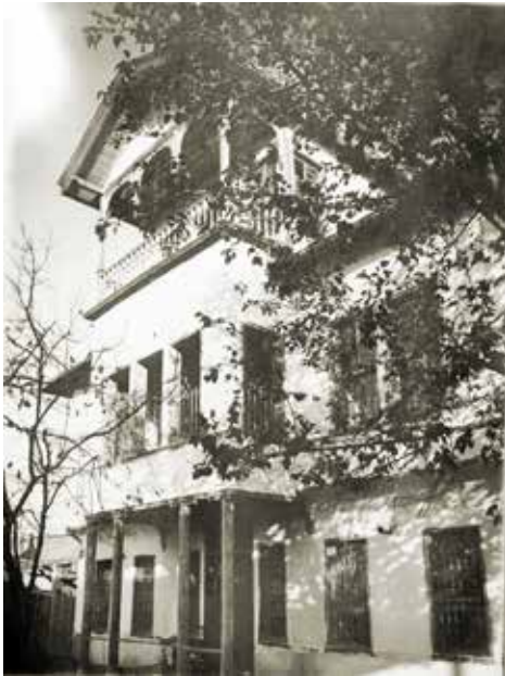
Çifte Merdiven Mektebi,

Mahalle Mektebi haline getirilmiş, 1895 yılında tekrar İbtidaiye dönüştürülmüştür. Okul 3 yıl iptidai, üç yıl da rüştiye olmak üzere altı yıllıktı. 1917'de Anadolu İntibah Mektebi adını aldı. 16 Ekim 1920'de kapatılmış, 1923 yılında tekrar açılarak Kültür Müdürlüğü'nün idaresinde öğretime devam eden Akif Paşa Rüştiyesi'nin ismi Akif Paşa İlk Mektebi olarak değiştirildi. Okul bi-