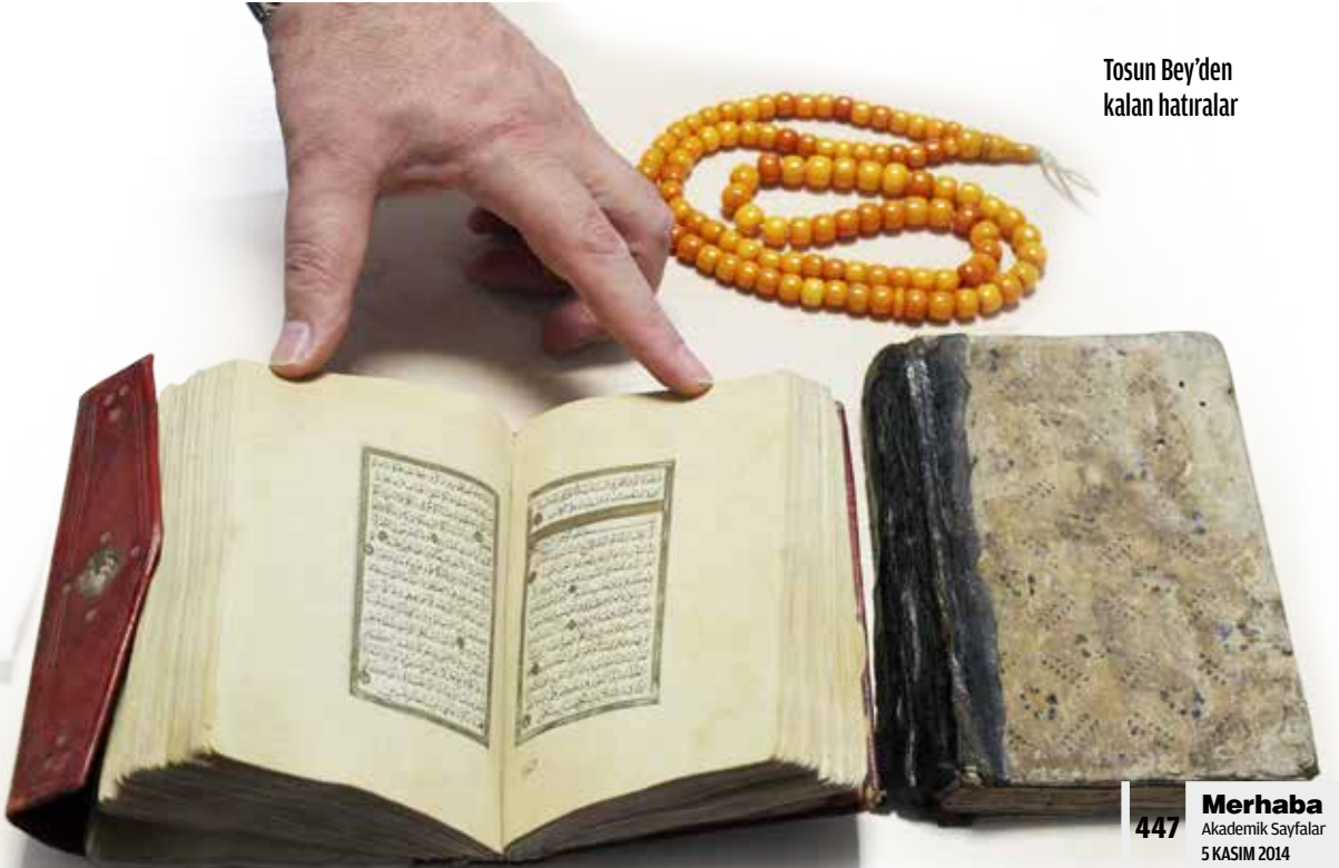
Tosun Bey'den kalan hatıralar