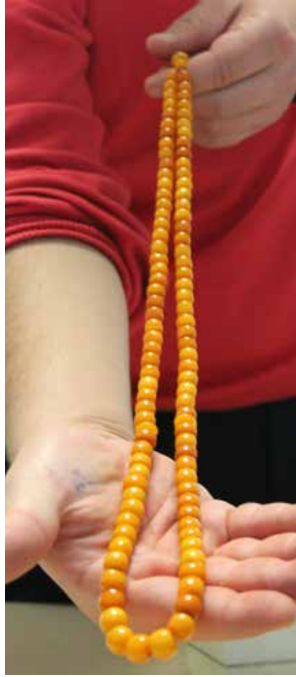
Tosun Bey'den kalan Alman Kehribarı Tesbih.

Aile başından beri devlete sadık olup, önemli hizmetler üstlenen insanlar yetiştirmiştir. İskânların ekserisi devlet tarafından yapılmıştır. Mesela Tosunların bir bölümü Ağabeyli'ye, bir bölümü Kulu Kozanlı'ya, bir kısmı Karaman Kazımkarabekir'e bir bölümü de Bozkır'a yerleşti-