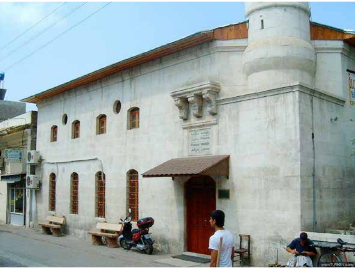
Memiş Paşa Camii (Havutoğlu Mescidi)