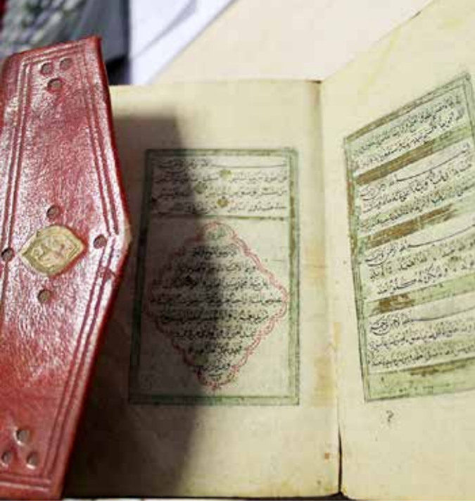
Tosun Bey'den kalan 1248 / 1832-33 tarihli el yazması Kur'an-ı Kerim.