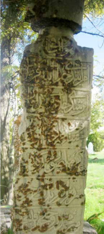
Memiş Paşa'nın Zivari (Altınekin)'da bulunan kabir taşı.