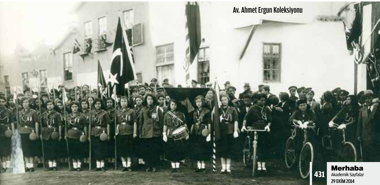
Av. Ahmet Ergun Koleksiyonu

Bütün halk hükümet meydanını ve istasyon caddesini doldurarak kahraman jandarmalarımız genç mekteplilerimiz bütün halk teşekkülleri ve köylerimizden gelen beş yüz atlı da resmigeçide iştirak etmişlerdi. Merasime iştirak eden demircilerimiz bizzat körük mengene, örs vesaire aletlerle işleyerek geçtiler. Şehrin umumi caddelerinde büyük bayram takları yapılmıştı. Bütün tüccarlarımız ve esnaflarımız dükkânlarının kapılarını bayrak ve fenerlerle donatıktan sonra palamut pürleri ile taklar yapmışlardı.