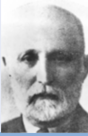
Hamdizade Abdülkadir (Erdoğan)