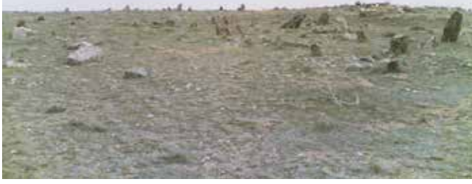
Eski müslüman mezarları.

10- Eski Başkuyulular: Başollar, Katrancılar, Gültenler, Güreller, Savranoğulları, Akçalar, Öcallar, Ünallar.