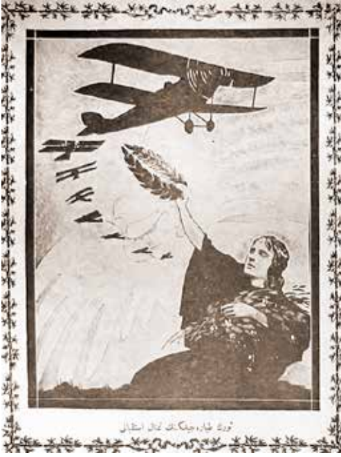
Türk Tayyare Cemiyeti Mecmuası ,Türk Tayyareciliğinin Timsal-i İstikbali,1 Şubat 1926

nakliye vazifesini görerek insan posta eşya-i ticariye ve şahsiye nakletmek suretiyle esnayı sulhta ifa edeceği hizmetleri söylemek gerekir (2) .”