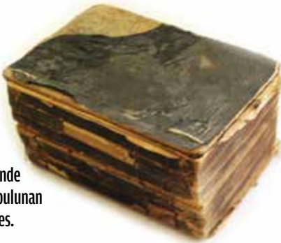
Başkuyu arazisinde gömülü olarak bulunan Kitab-ı Mukaddes.

kuyu" bir yerleşim yeri olarak görülmektedir (bk. Osmanlı Döneminde Başkuyu Haritası). Ancak Başkuyu'nun varlığı bundan da eski tarihlere –en azından - Bizans Dönemine kadar uzanmaktadır. Çocukluk yıllarımızda, beldenin Ağın (Ak - in)