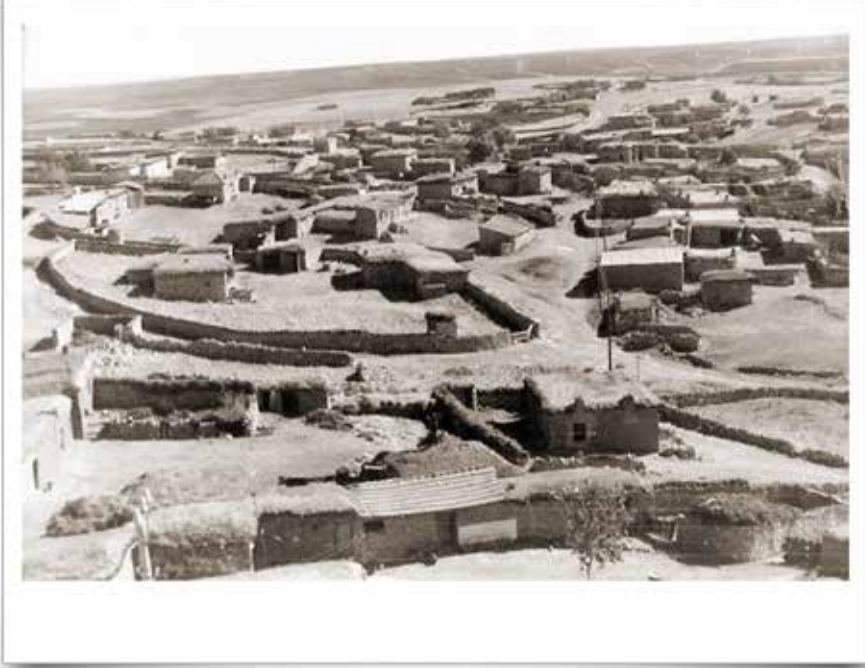
1960'lı yıllarda Başkuyu'dan genel bir görünüm.

“yürüyen” demektir; sözlükte “göçebe, göçerev, göçer” manasına gelir. Yörük kelimesinin XIV. yüzyıldan itibaren ortaya çıkmış ve yaygın biçimde kullanılmış olması mümkündür (Sümer 2013: 570). Zaman zaman bazılarınca bu konar - göçer Türkmenleri ifade etmek için kullanılan “Yürük” tabiri ise yanlış bir kullanımdır. Zira bu kelime bir sıfat olan “yügrük (>yürük)” kelimesinden gelmektedir. Bu itibarla “Yürük at yemini artırır” atasözünde de kullanıldığı gibi “güçlü, çevik, çalışkan, eline ayağına çabuk; (at vb. için:) iyi yürüyen, koşan” anlamlarındaki “yürük”le göçebe Türk kabilelerini ifade eden “Yörük”, tür ve anlam bakımından tamamen birbirinden farklı kelimelerdir (Dulkadir 1997: 9 - 10).