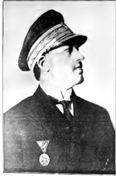
تورک طیاره جیمشک - جیمی برقی نیرت قرزی هراد عباس آله انصاری ملی طیاره وندازی تورکمان اولنومبر ۱۳۲۱