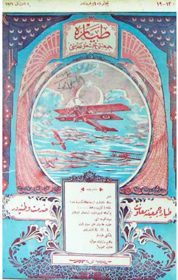
“Cumhuriyetin İlk Yıllarında Tayyareler”, Türk Tayyare Cemiyeti Mecmuası, 1 Kanunu Sani 1926

kartal oldu. Beşyüz kilometreye yaklaşan bu süratin en seri ekspreslerden beş defa daha süratli olduğunu hatırlamak tayyarenin vesait-i nakliye aleminde daha şimdiden yaptığı inkılabın azametini ve hava devrinin nasıl mühim bir devir olduğunu olacağını ispata kifayet eder. Tayyarelerin yollu yolsuz memleketlerde seri vasita-i