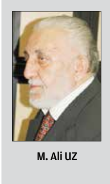
M. Ali UZ

Eskiden soyadı bulunmadığı için bu ailelerin her birinin halk arasında yay-