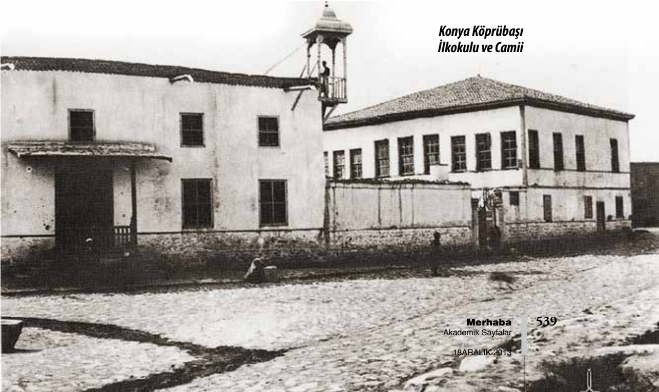
Konya Köprübaşı İlkokulu ve Camii