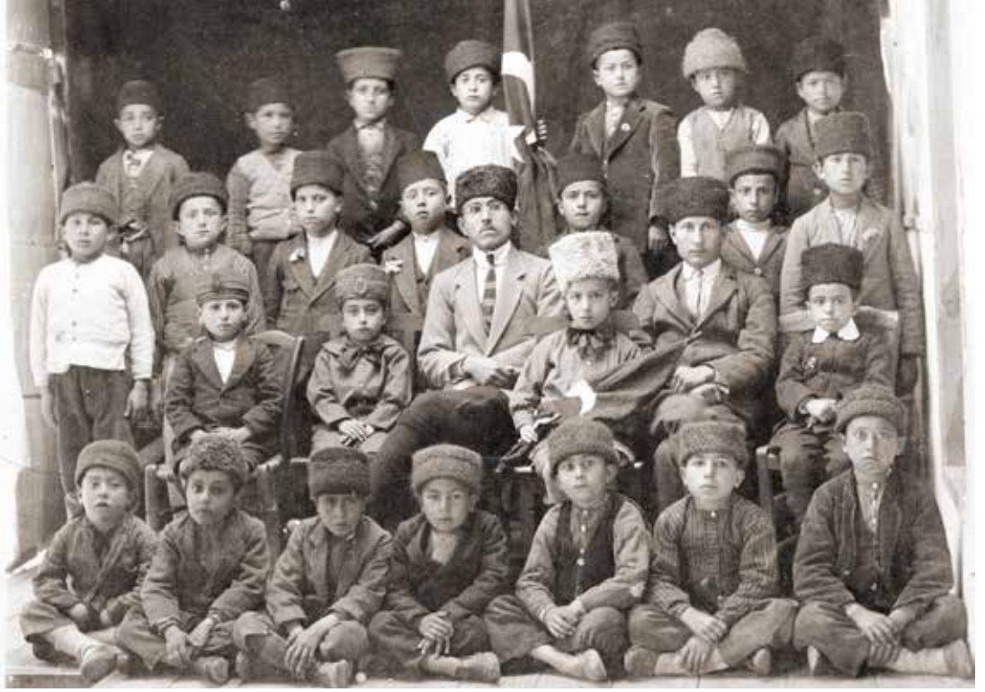
Akşehir'de Muallimler ve Talebeleri