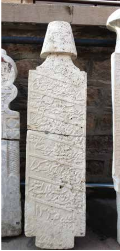
Ayaşlı'nın mezar taşı

Mezar taşları üzerine önemli bir mesai harcamış fakir, gerek sanat tarihi gerekse yerel tarih açısından önemli mezar taşlarının bir müzede, ancak ka- palı bir mekânda muhafaza edilip ser- gilenmesinden yanadır. Bu dileğini de müteaddit yazılarında ortaya koymuş- tur zaten. Şayet, bu mübarek yurdun tapuları mesabesindeki bu ata yadigârları böyle lalettayin ortamlarda