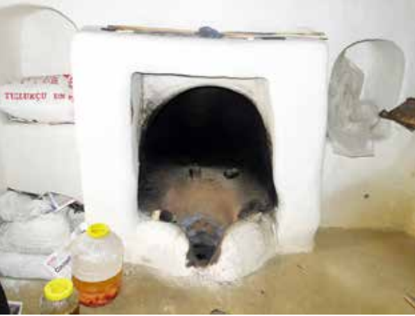
Hasan KILIÇ EVİ;

Cumbanın bulunduğu odada seki bulunmaktadır. Ayrıca yapının zemin katında bir kısmı tahıl deposu diğer kısmı su deposu olarak kullanılan bir bölümü vardır. Eve ait müştemilatta eski ocaklar (tandır) ve ocakların yan kısmında iki duvar nişi bulunmaktadır.