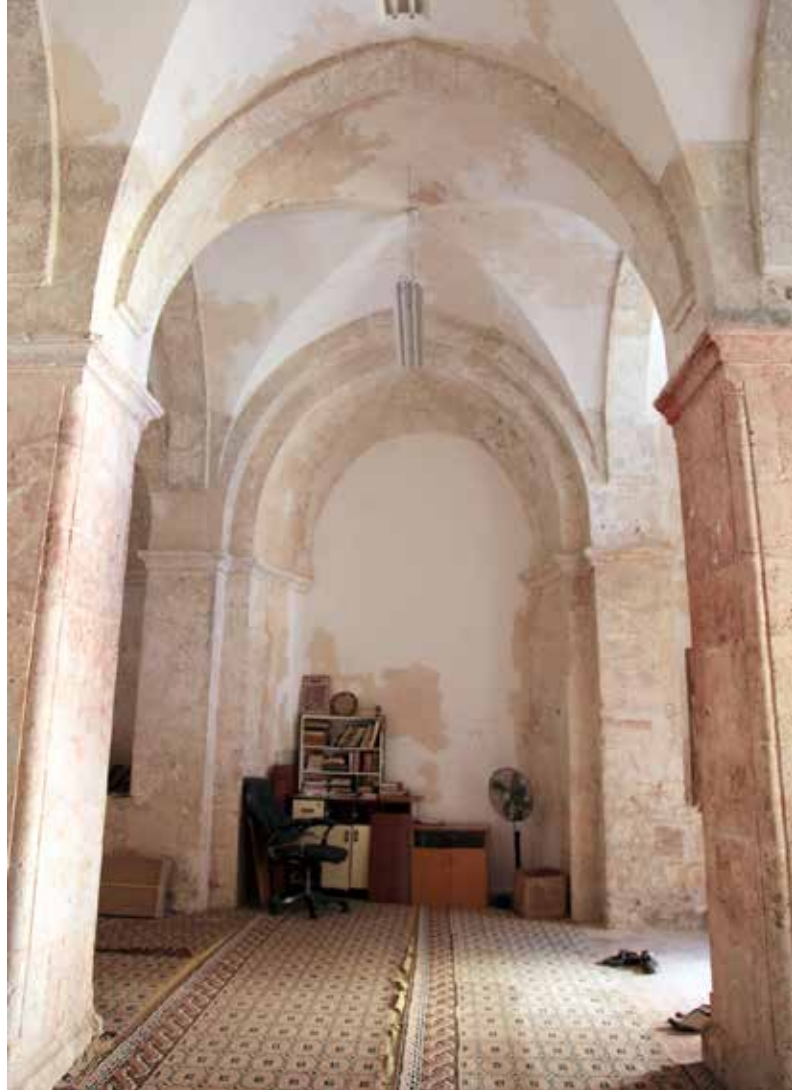
Kudüs Mevlevîhanesi Camii'nin harimi