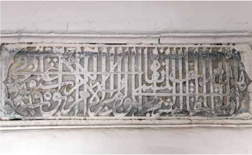
Semahane ve minareye ait kitabe

da müze haline dönüştürülebilir. Burada Türk kültürünü ve Mevlevîliği yansıtan materyaller sergilenebilir. Şu haliyle Kudüs'e gelen Türklerin burayı bulmaları, bulsalar bile ziyaret edebilmeleri pek mümkün değil. İçeriye girebilmek burada ikamet eden ailelerin insafına bağlı... Kudüs Mevlevîhanesi'nin yeniden düzenlenebilmesi ancak Türkiye'nin girişimleriyle mümkün olabilecek bir şey. Lübnan'ın Trab-