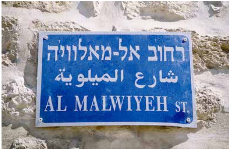
Üç dilde yazılmış El Mevleviye Sokağı'na ait levha

birbirine bağlı. Kudüs'ün her yanında olduğu gibi korku burada da hüküm sürüyor, sur kapılarında İsrail askerleri nöbet tutuyor. Sokaklar kameralarla donatılmış. Bu olağanüstü güvenlik tedbirlerine rağmen hayat normal akışı içerisinde devam ediyor. İnsanlar surun dar sokaklarında yürüyerek işlerine gidiyor, çocuklar olanca saflıklarıyla oyun oynuyorlar. Gerçi bu sadelik ve sakinlik fırtına öncesi sessizlik gibi bir şey... Her an bir şey oluverecekmiş gibi bir his var insanın içinde. Kudüs'ün taş sokaklarında yürüyebilmek ise ayrı bir bahtiyarlık.