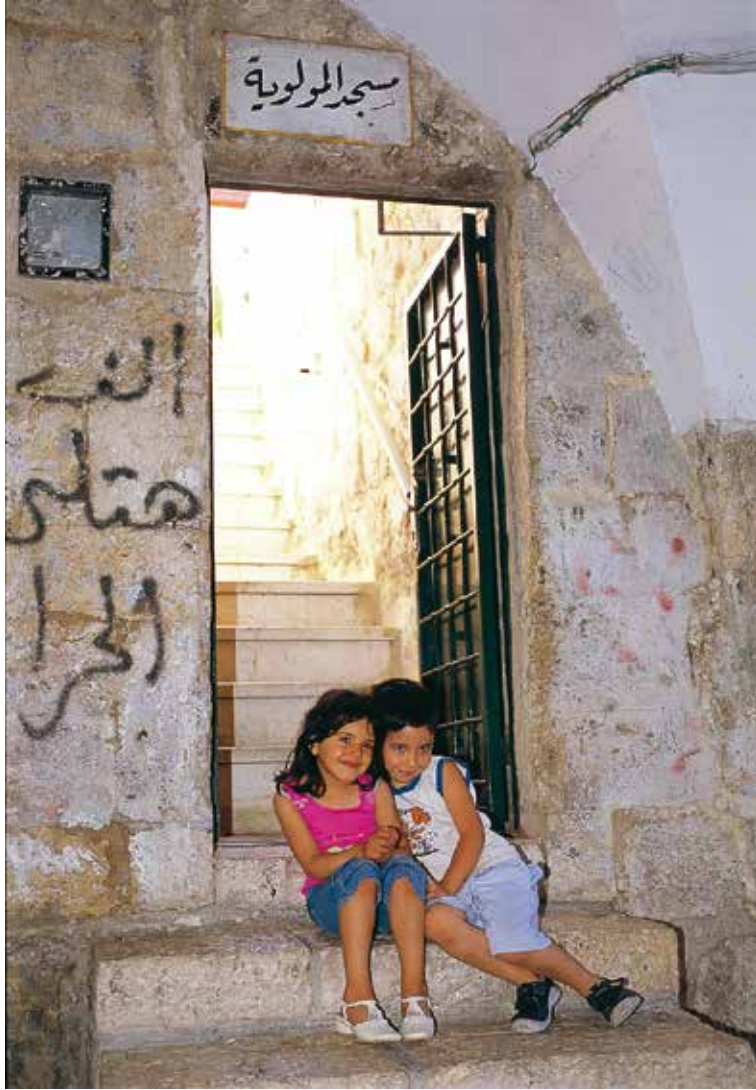
Mevlevîhanenin avlu girişi