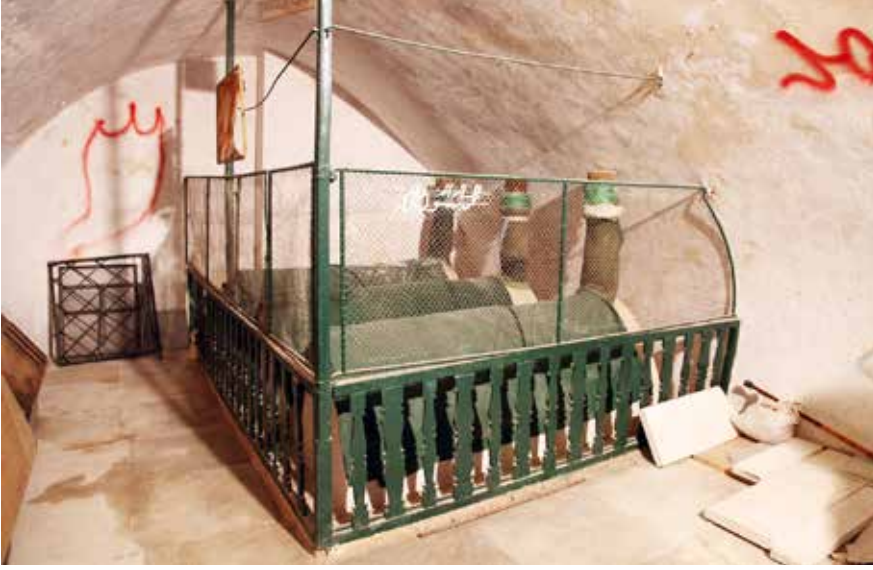
Türbe içerisindeki sandukalar