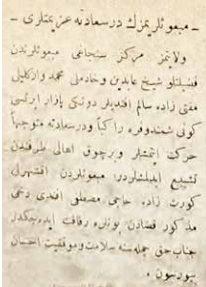
Konya Gazetesi 4 Teşrinî sani 1334

gibi o ahaliye dayanıp güç yetirmeye kalkışır. Ve ahaliye de yavaş yavaş kuvvetinin altına alır. Memuriyeti de o zaman memuriyet-i mutlaka sırasına girer. Ve ahali kendi tayin ettikleri memurun esiri olur.