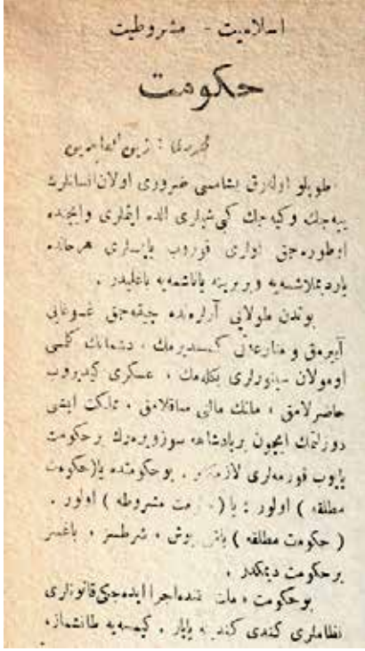
Hak Yolu, 31 Temmuz 1919 sayılı nüshası